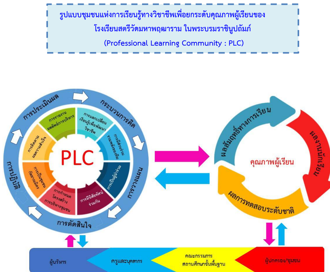
ภาพที่ 4.1 รูปแบบชุมชนแห่งการเรียนรู้ทางวิชาชีพเพื่อยกระดับคุณภาพผู้เรียนของ โรงเรียนสตรีวัดมหาพฤฒาราม ในพระบรมราชินูปถัมภ์ สำนักงานเขตพื้นที่การศึกษามัธยมศึกษา เขต 2

จากภาพที่ 4.1 สามารถอธิบายรายละเอียดได้ ดังนี้